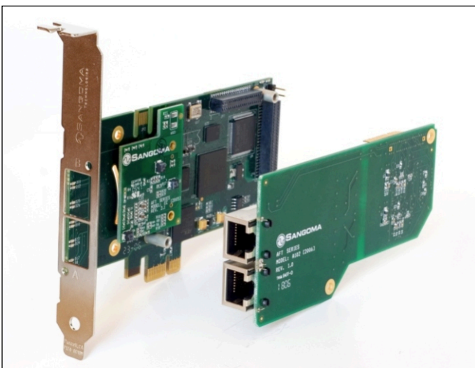
A102 PCI Express desmontada

A A102 é a versão de porta dupla da família de equipamentos de Telecomunicações Flexíveis Avançadas (AFT) da Sangoma, projetados para suporte ideal de voz e dados sobre T1, E1.